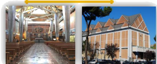
Parr.S.GREGORIO VII Via del Cottolengo, 4