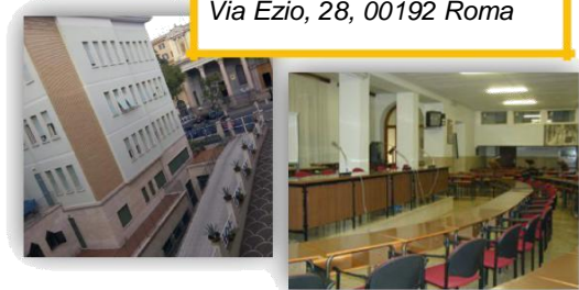
CASA MARIA IMMACOLATA Via Ezio, 28, 00192 Roma