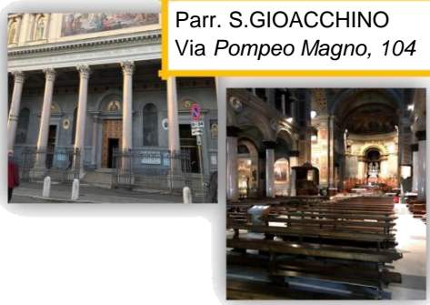
Parr. S.GIOACCHINO Via Pompeo Magno, 104