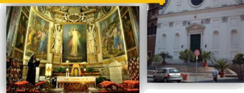
S. Spirito in Sassia (Santuario della Divina Misericordia) Via dei Penitenzieri, 12