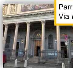
Parr. S.GIOACCHINO Via Pompeo Magno, 104

Venerdì mattina , le conferenze si terranno in 6 lingue diverse (Inglese, Spagnolo, Italiano, Portoghese, Francese e Polacco) e ci saranno 6 sedi destinate ai diversi gruppi linguistici.